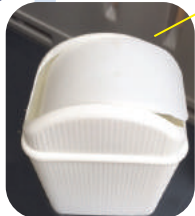
⑨ サニタリーボックス